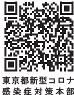
東京都新型コロナウイルス感染症対策本部

☎03-5320-4592 午後5時～翌午前9時(平日) 土・日曜日、祝日は終日受付