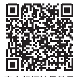
東京都福祉保健局

ホームページからFAX相談票をダウンロードし、必要事項をご記入の上、上記FAX番号あてにご送付ください。