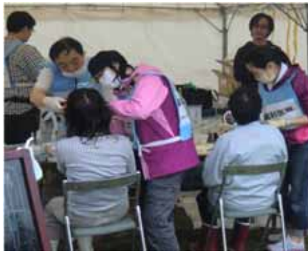
被災地での支援の様子です。